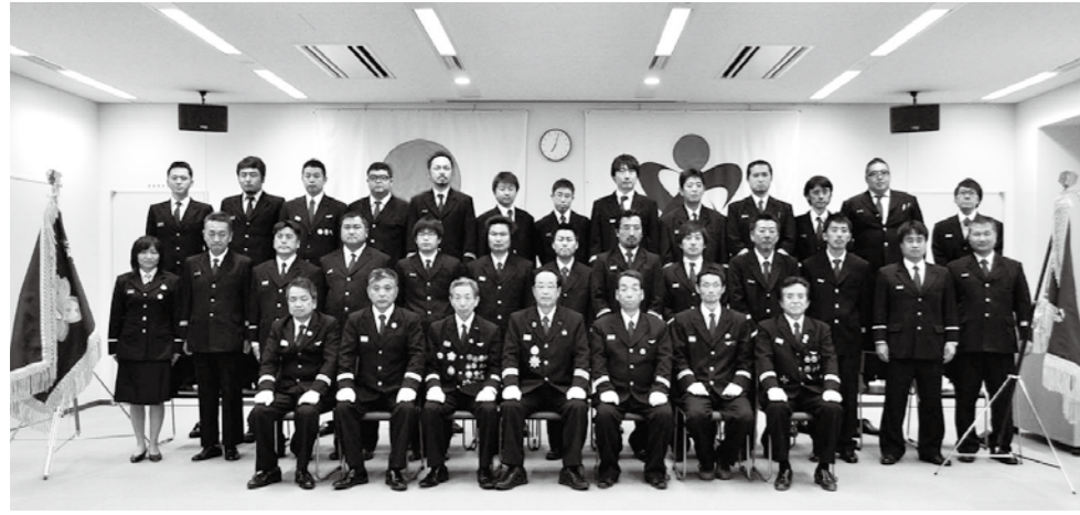
深谷市消防団役員の皆さん

発生した時には、直ちに住民の皆さんの生命・身体・財産を守るため、昼夜を問わず活動しています。消防団活動に対する皆さんのご理解とご協力をお願いします。