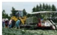
機械化体系の導入