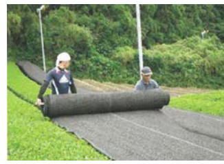
茶の被覆作業の実施