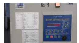
環境制御盤の導入